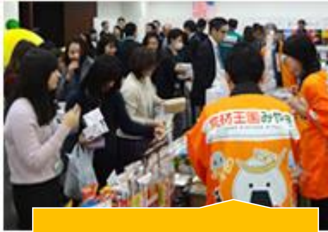
農業事業者に対する支援