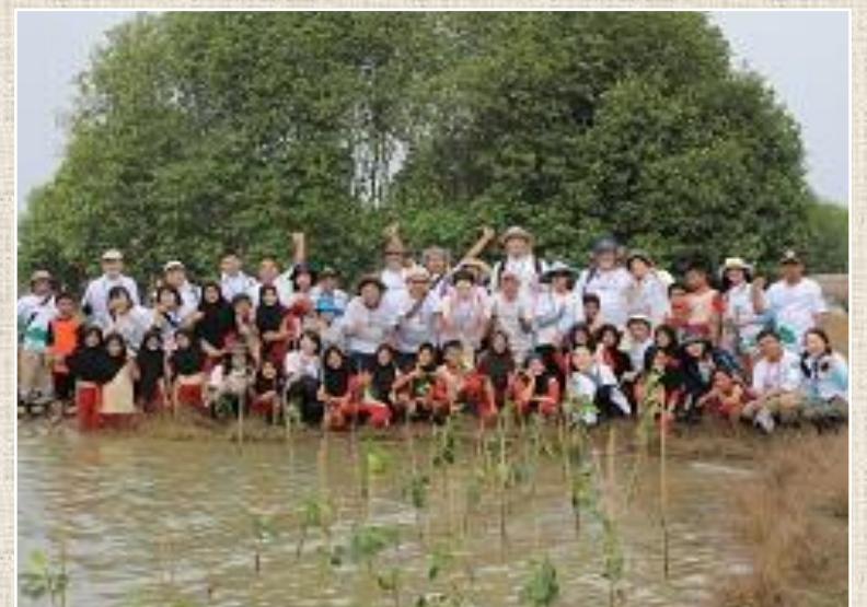
環境・自然災害取組み