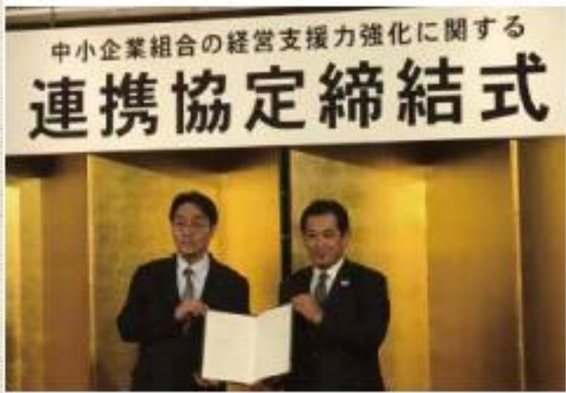
自治体との共同取組み