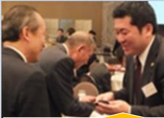
ビジネスマッチング等