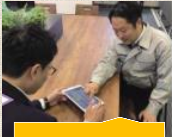
情報発信による支援

例) ・ 企業交流会や企業PRのための講演会・セミナー等の開催 ・ 地域企業の海外展開支援およびインバウンド対応支援（保険によるサポート、ニーズに応じたセミナー開催） など