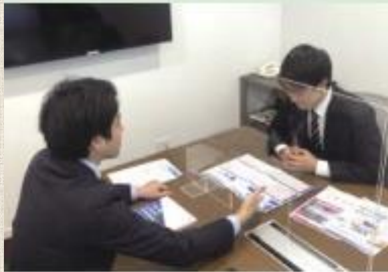
企業の持続可能な経営支援